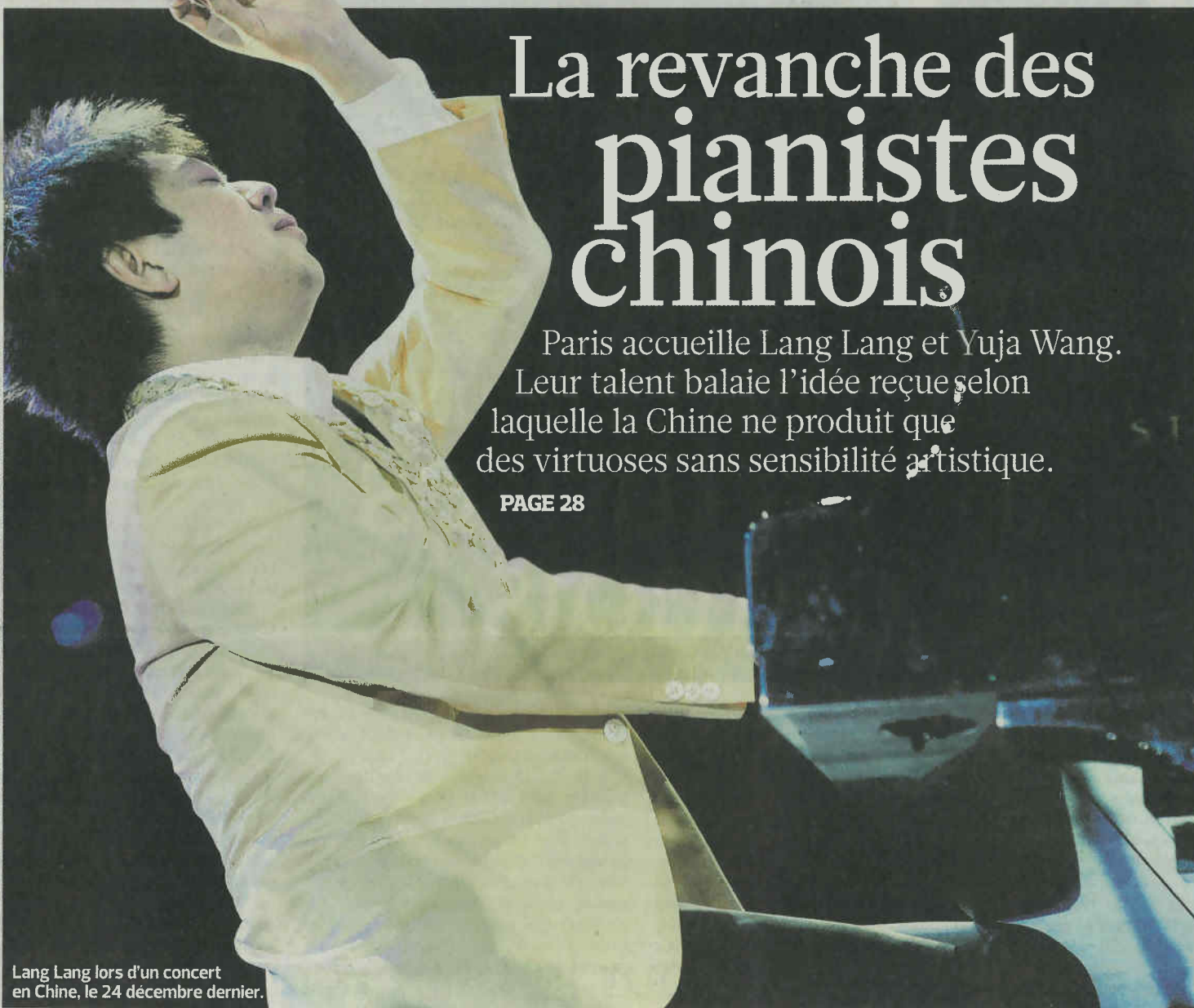
Lang Lang lors d'un concert en Chine, le 24 décembre dernier.